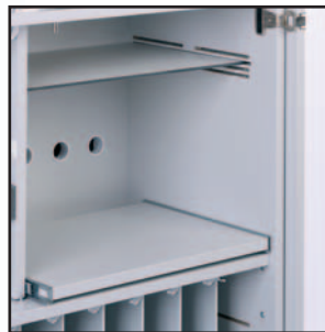
Option Drucker und Beamer