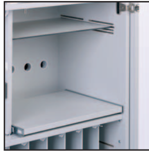
Option Drucker und Beamer