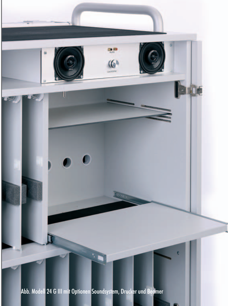
Abb. Modell 24 G III mit Optionen Soundsystem, Drucker und Beamer