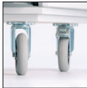
Option Rollensatz "Weich"