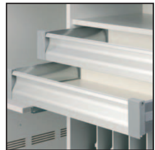
Sonderanfertigungen z.B. mit Schubladen